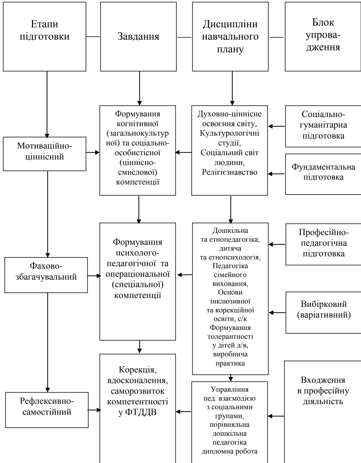
Рис.2. Процес упровадження системи професійної підготовки майбутніх вихователів до ФТДДВ

Експериментальна перевірка системи професійної підготовки до ФТДДВ, з забезпеченням умов її реалізації та використання відповідного навчально-методичного забезпечення навчально-виховного процесу відбувалася у три етапи: мотиваційно-ціннісного, фахово-збагачувального та рефлексивно-самостійного (рис.2).