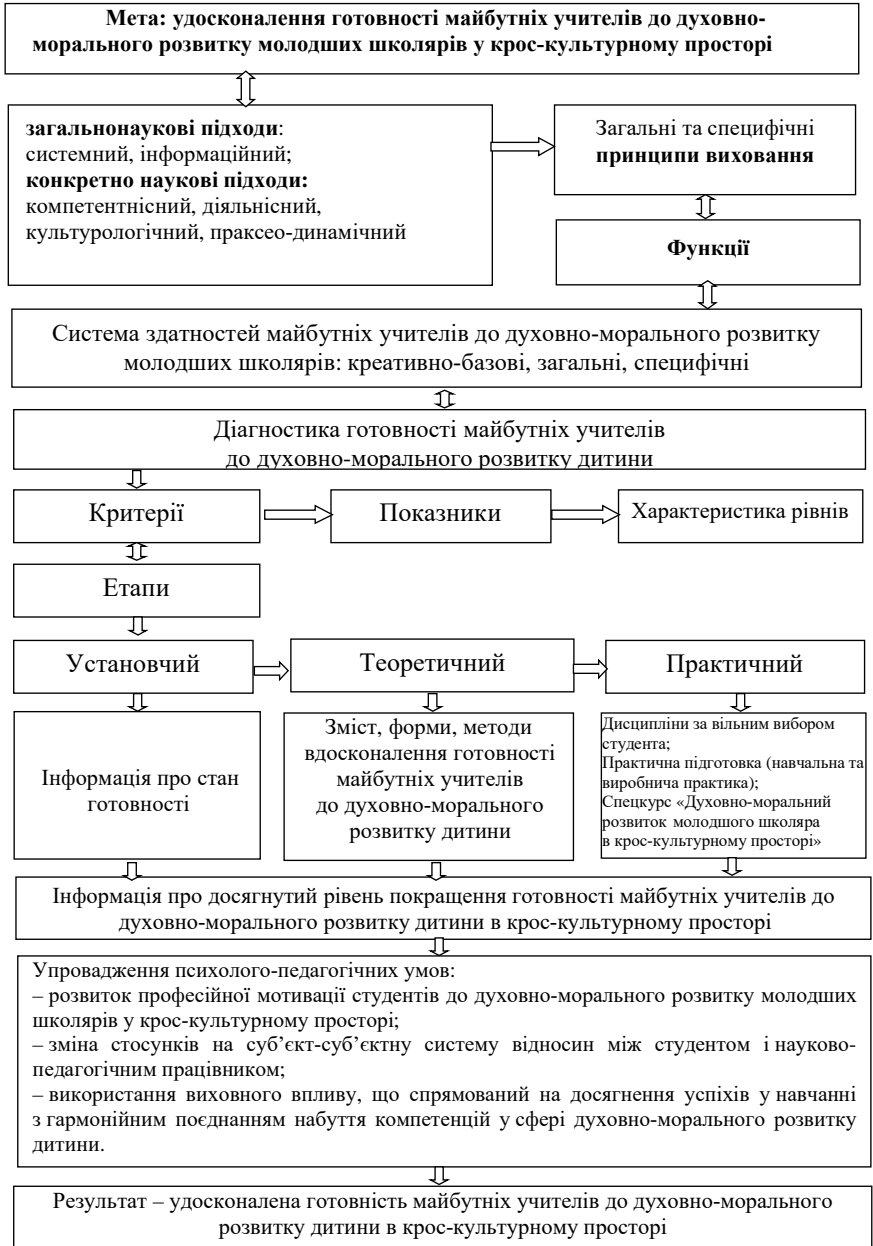
Рис. 1. Модель процесу вдосконалення готовності майбутніх учителів до духовно-морального розвитку молодших школярів у крос-культурному просторі